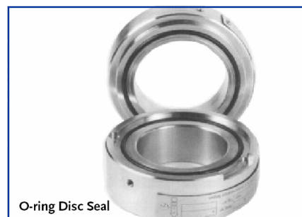
O-ring Disc Seal

Przez wysoki współczynnik przepływu jakim charakteryzują się płytki bezpieczeństwa Poly-SD oraz możliwością zakresu pracy do 95% ciśnienia rozerwania oraz doskonała odporność na przeciwcisnienie są najlepszym rozwiązaniem dla ochrony zaworów bezpieczeństwa.