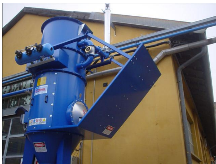
ODPOWIETRZANIE FILTRA Z PŁYTĄ TYPU DEFLEKTOR

Innym rozwiązaniem, technicznie bardziej zaawansowanym nie koniecznie droższym są aktywne systemy tłumienia wybuchów. Zaletą tych systemów jest niewielki wzrost ciśnienia wewnątrz chronionego aparatu oraz minimalna ilość zwęglonych elementów wewnątrz chronionego apa-