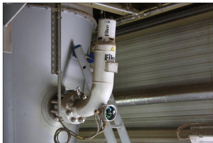
BUTLA HRD NA CYKLONIE

Instalacja jednak była wyposażona w aktywny system izolacji wybuchu typu SRD, który zadziałał we współdziałaniu z odpowietrzaniem wybuchów i przerywaczem