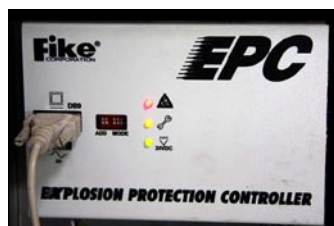
SERWER DETEKCJI WYBUCHOW PO AKTYWACJI

z podwójnymi, ukrytymi kosztami zarówno samego sprzętu jak i jego magazynowania. Innym rozwiązaniem jest oczekiwanie na wysyłkę napełnionych butli przez producenta, co wiąże się z długim czasem oczekiwania na nowe butle, co w wypadku firm korzystających z tak zaawansowanych systemów jest często nieakceptowane.