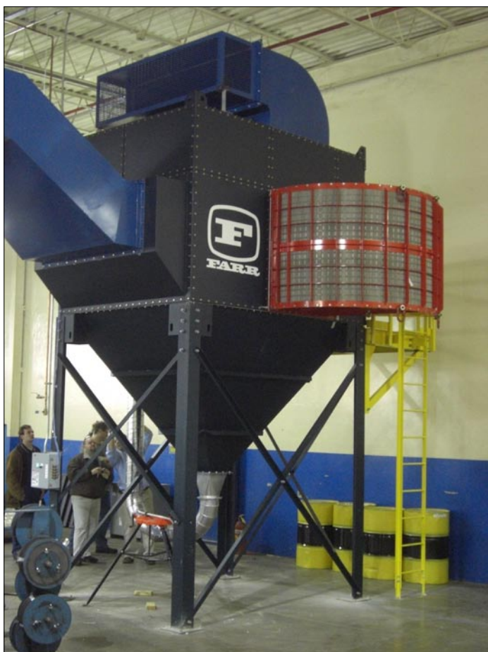
NAJWIĘKSZY PRZERYWACZ OGNI DOSTĘPNY NA RYNKU

Zależnie od zastosowania można spotkać płyty bezpieczeństwa okrągłe lub prostokątne. Tego samego kształtu są też przerywacze ognia współpracujące z danym typem płyt bezpieczeństwa.